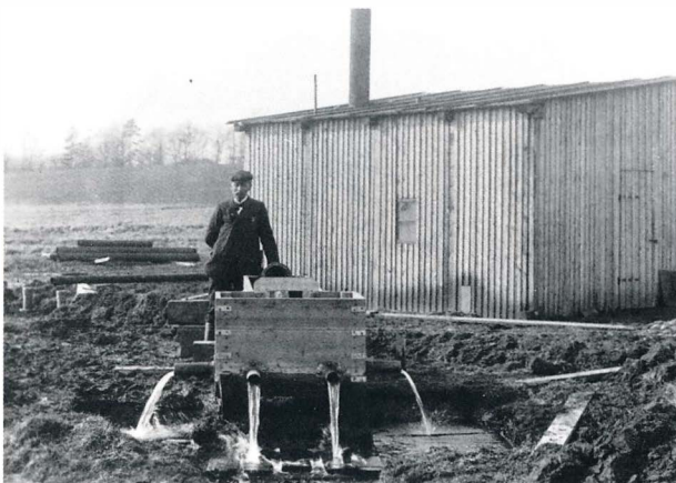
Der blev foretaget mange prøveboringer forud for anlæggelsen af værket.