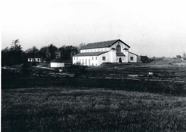
På den bare mark har det store maskinhus kunnet ses langvejs fra. Med den nationalromantiske byggestil har det været et fremmedartet byggeri på egnen.